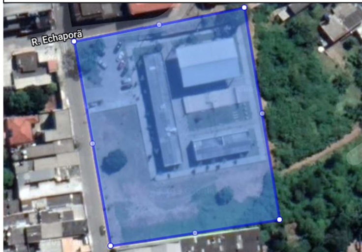
Imagem satélite Praça dos esportes e cultura "IRINEU LUCIO RODRIGUES" (PEC)