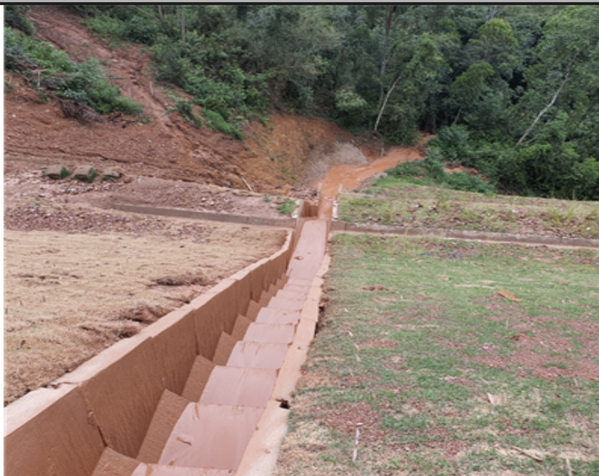
escada hidráulica descendo barro