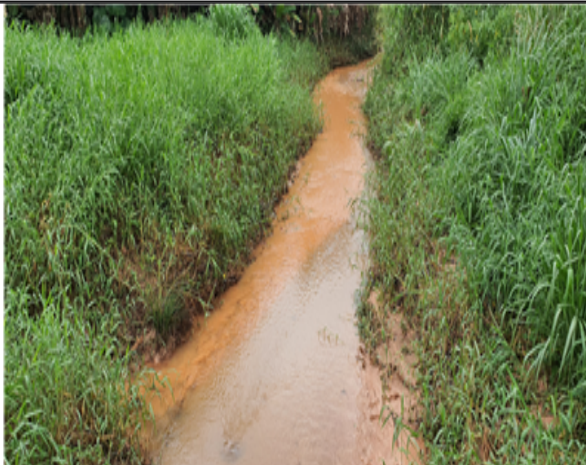
entrada do empreendimento córrego assoreado