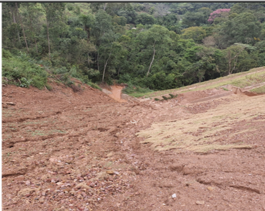
Um dos ponto de assoreamento- talude c/ erosão