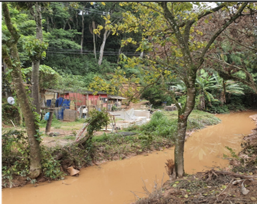
comunidade do km 43 córrego assoreado