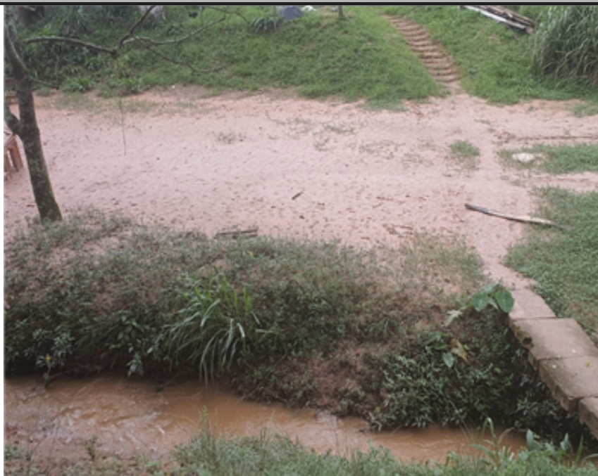
interior da comunidade km 43