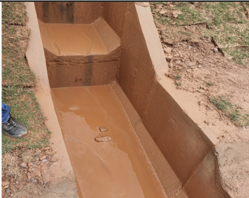
barro descendo pro córrego